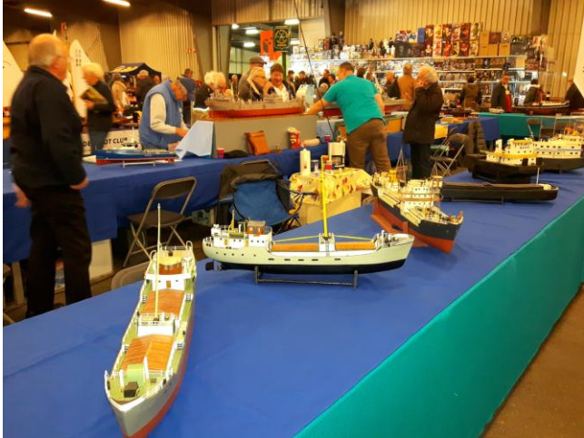
Modellen van Frans

Maar we kregen het goed voor elkaar, de voorzijde lichtblauw en de bovenzijde donkerblauw, zag er goed uit mochten we wel na afloop concluderen.